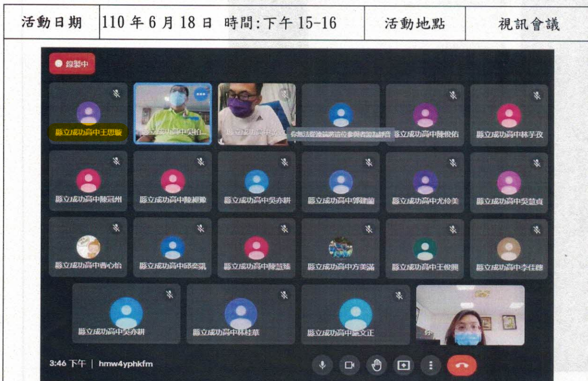
照片說明:【出席 22 位, 如附件 1-1】