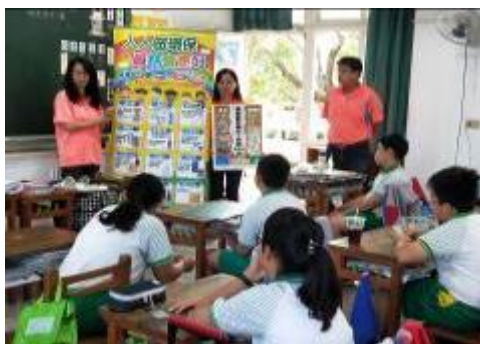
愛護地球～資源回收宣導