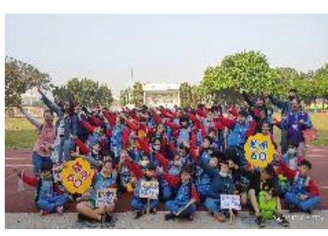
愛護地球～節能宣導