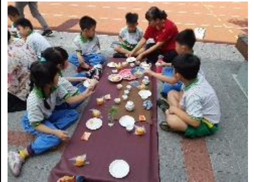
修身養性～茶道藝術