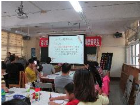
教師精進～品德教育研習