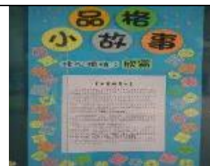
典範學習～品德之星表揚