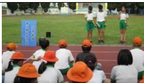
愛心義賣捐家扶基金會