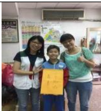
品格劇場～色盲女孩的繪畫 夢想