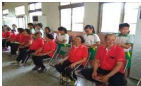
響應勵馨基金會辦理兒童防 治性侵害宣導活動