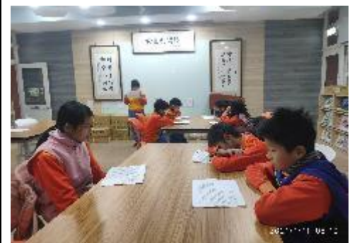
品德教育藝文競賽