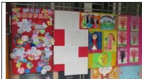
服務學習～ 大饒社區老人服務