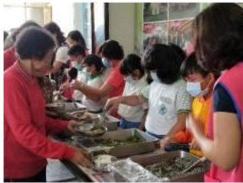
服務學習～ 大饒社區老人服務