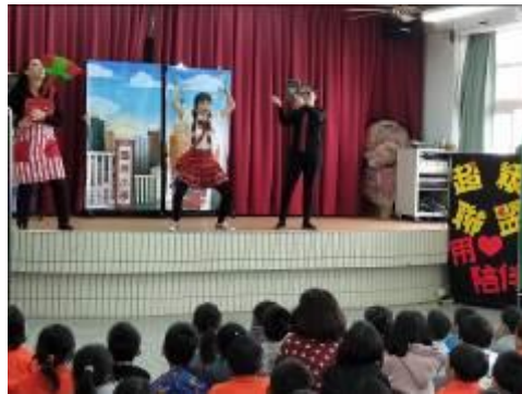
品格劇場～ 超級聯盟用愛陪伴