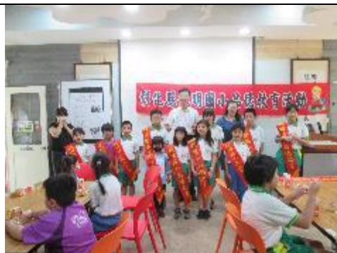
典範學習～品德之星表揚