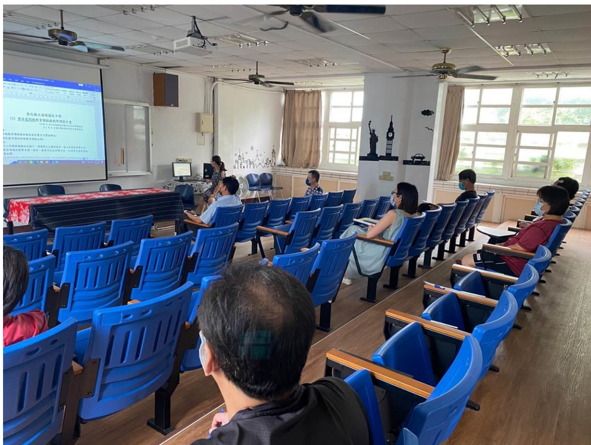
提案討論二~說明課程與教學調整計畫的內容並討論