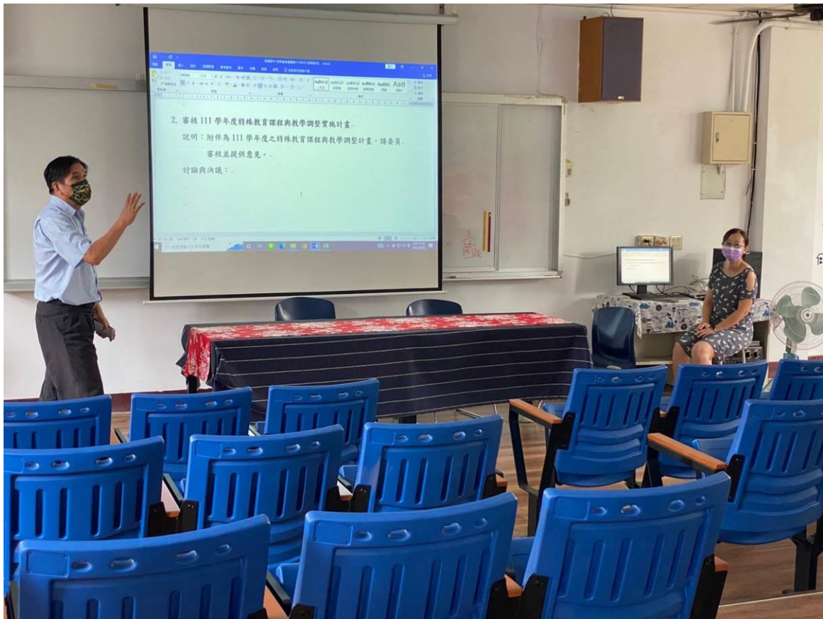
校長主持提案討論~提案二