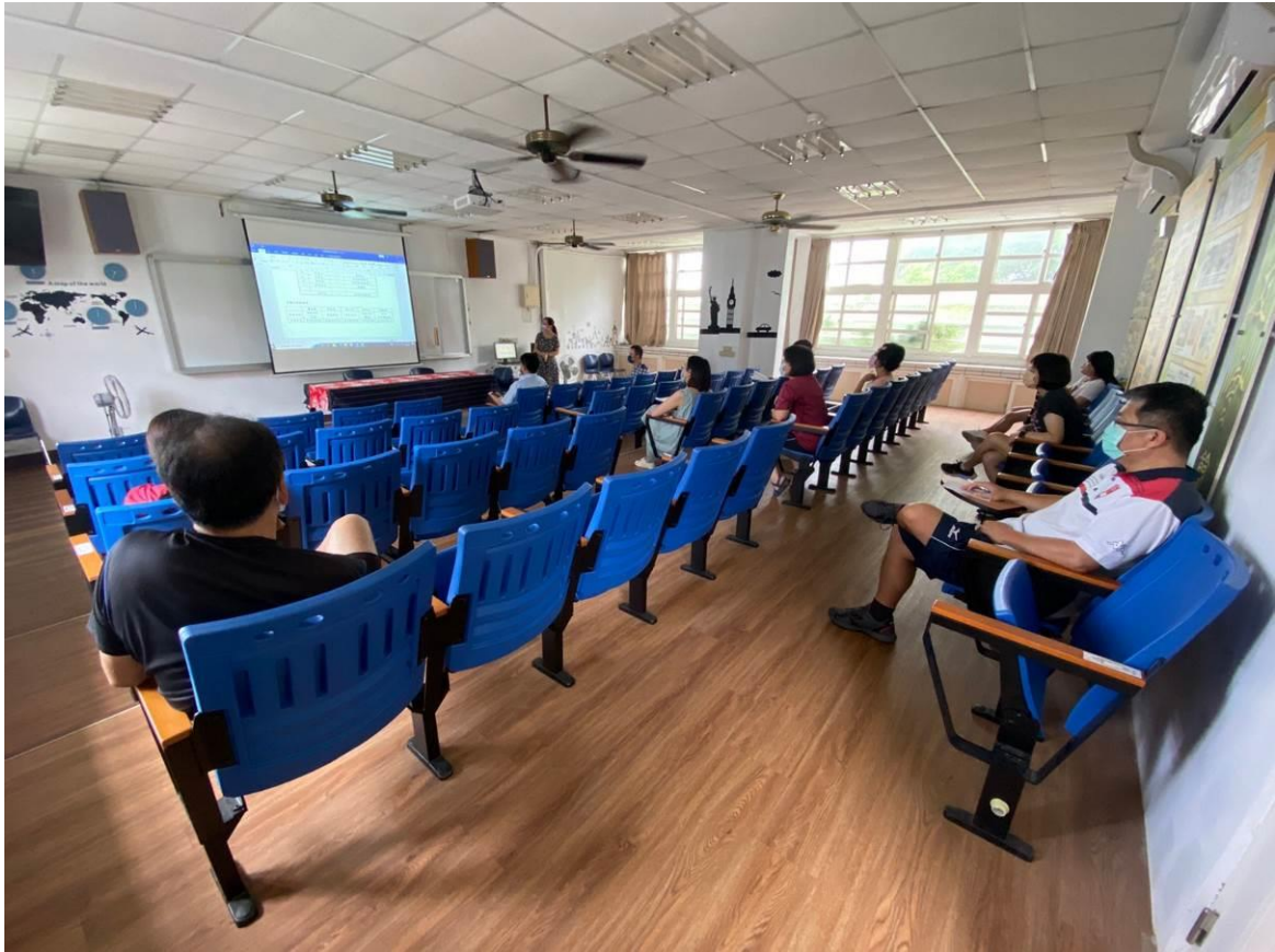
特教期末工作報告