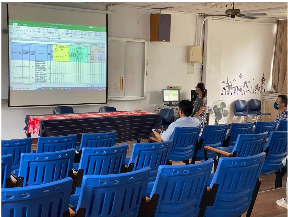
提案討論一~說明學生能力彙整表的內容並討論