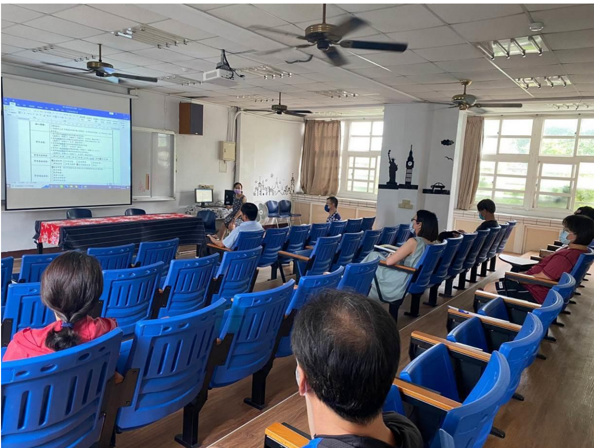
提案討論三~說明課特教課程計畫撰寫的內容並討論