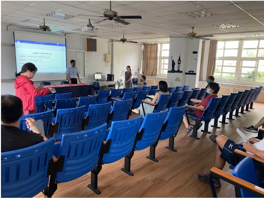
校長主持 110 學年度第 2 學期期末特推會