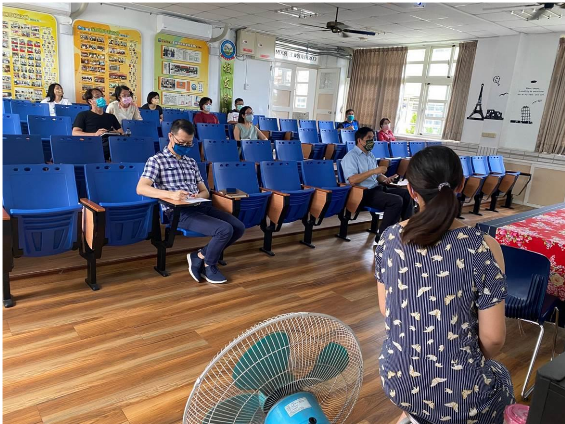
疫情停課期間，加大座位距離