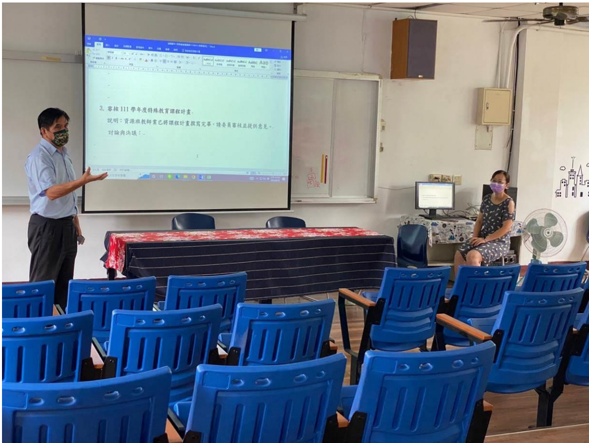
校長主持提案討論~提案三