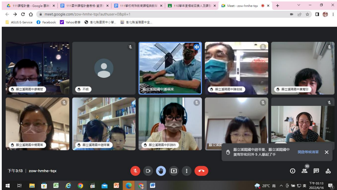
以舉手方式進行提案表決