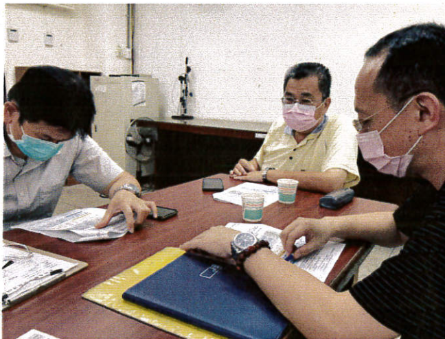
校長主持特推會議