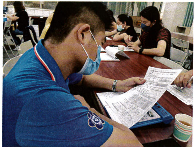
總務主任報告無障礙設施