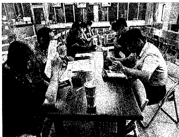
委員確實出席會議